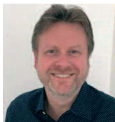
Emmanuel Garot Président national

L'heure des choix se précise. S'il est vrai que pour certains jeunes l'orientation scolaire semble s'inscrire dans une trajectoire toute tracée, pour d'autres, sans projet défini ou avec des résultats scolaires trop fragiles, le chemin s'annonce plus incertain et les décisions à prendre plus complexes.